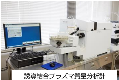
誘導結合プラズマ質量分析計