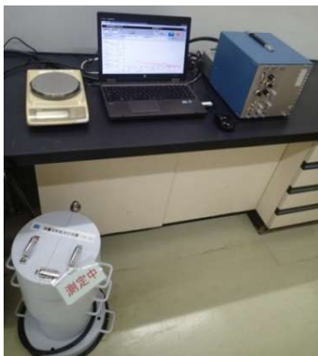
放射性物質検査装置

また、これらの原料を使用して製造している乾燥カットわかめ等の三陸産わかめ関連製品につきましても、製造日毎に検査を行っており、 現在まで放射性物質は検出されておられません。