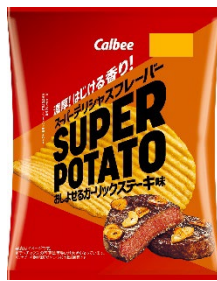
カルビー「スーパーポテト おしよせるガーリックステーキ味」 (左から70g、56g)