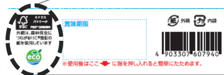
※パッケージ底面に表示