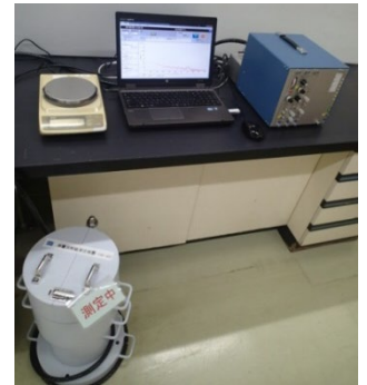
(右図：放射性物質検査装置)

三陸産わかめは、行政や全漁連における継続的な放射性物質モニタリング検査が実施されておりますが、さらに万全を期すため、当社で調達した原料および製品について、 放射性物質（セシウム-134、セシウム-137 検出限界：各10Bq/kg）の自主検査を実施し、安全性を確認しております。